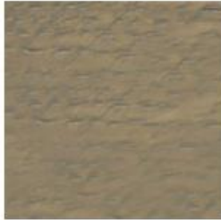
GRIS TRAPEADO R- 212