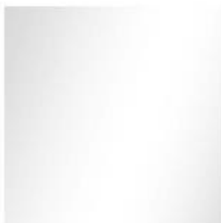
ACERO INOXIDABLE R-812