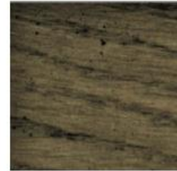
NEGRO TRAPEADO E- 209