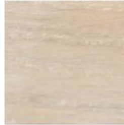
BLANCO TRAPEADO R-211